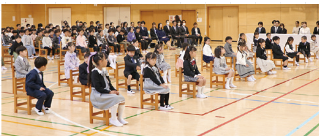
▲緊張した様子の新入生

新治小学校では、25名の新入生が入学しました。期待と少しの緊張を胸に笑顔で小学校生活の第一歩を踏み出しました。元気よく「はい」と返事する姿からは、これから始まる学校生活への大きな期待と喜びが伝わってきました。