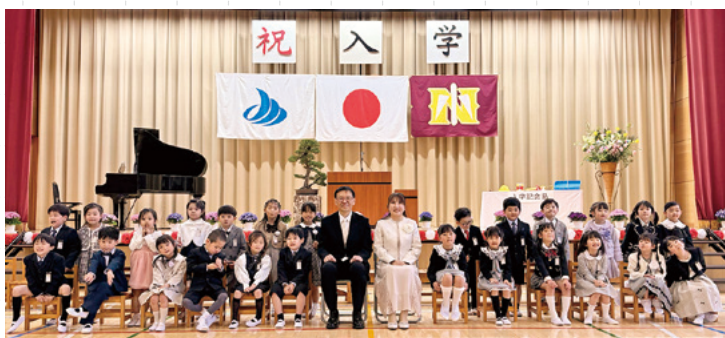
▲新入生の全体写真