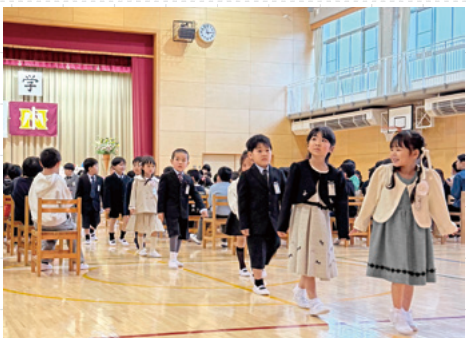
▲暖かい拍手で見送られ笑顔の新入生

春らしい暖かな天気が続くようになった4月上旬、町内のこども園や小中学校、利根商業高等学校で入園式や入学式が行われ、園や学校での新しい生活がスタートしました。