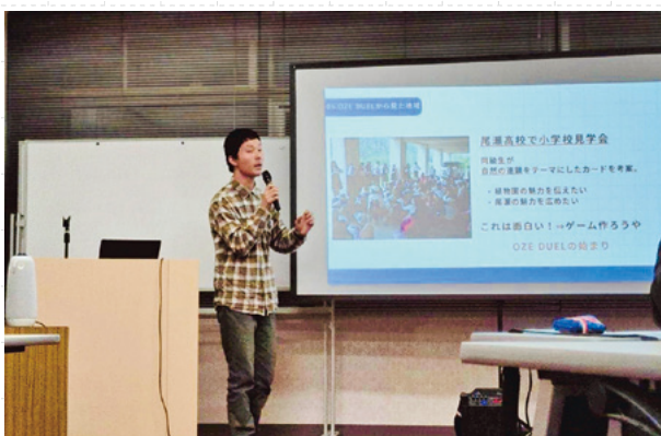
▲地域課題解決カードゲーム講座

また、3月16日には、第3期「みなかみ町SDGsパートナー制度」の認定授与式を開催。トコヤホンダ、葉屋云々、キャニオンズ、REBLUE、高崎商科大学萩原豪研究室、フォトスタジオ佐川、増田鉄工所、MinakamiCoffee、ひととき(敬称略)といった多彩な事業者や団体が認定を受け、活動を発表しました。「様々な業種の方と交流でき刺激になった」「連携に期待できる」との声が聞かれ、SDGs達成に向けた連携の重要性を再認識する場となりました。