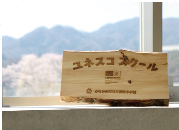
▲各校に掲げられた「ユネスコスクール」プレート

昨年11月にみなかみ町内の全小中学校がユネスコスクール加盟校となってから初めての春を迎えました。みなかみ町の豊かな自然を象徴するイヌワシの生育を守るために切り出した材(イヌワシ木材)を活用したオリジナルのプレートが各学校で掲げられました。癖が強く建築材としては不向きな木材ですが、このように活用することはみなかみ町ならではの取り組みとして注目を集めています。