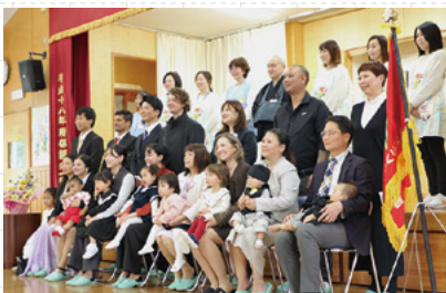
▲新入園児の全体写真