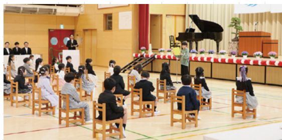
▲在校生からの歓迎の言葉