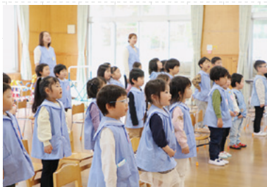
▲在園児からの歌のプレゼント