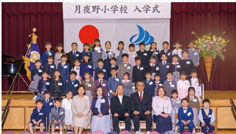
▲新入生の全体写真

校歌斉唱では、児童たちが新しい校歌を元気いっぱいに歌い、みんなで新たな一歩を祝いました。