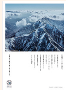
▲澁澤さんが手がけた 当町20周年 コンセプトビジュアル