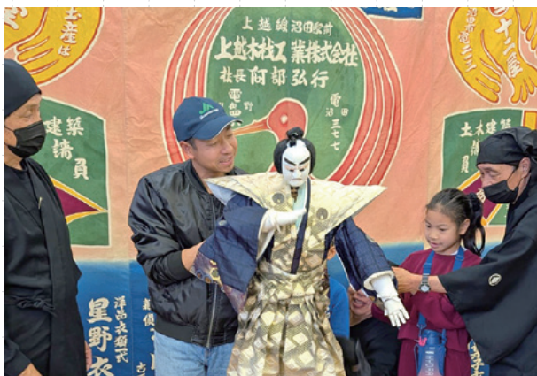
▲人形を操作する体験会

当日は、お子さま連れのご家族からご年配の方々まで、幅広い年齢層のみなさんが参加しました。3人で一体の人形を操作する体験に挑戦したり、迫力ある実際の演目を鑑賞したりと、地域の伝統文化に深く親しむ機会となりました。