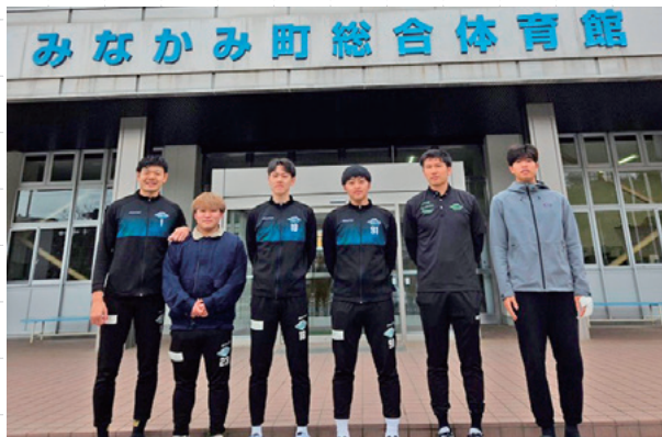
▲指定管理者となった水上自然遊楽