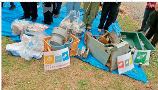
▲「持続可能なごみ拾いとは」をテーマにみなかみ町で都会の学生さんと地域住民と一緒にゴミ拾いをした様子