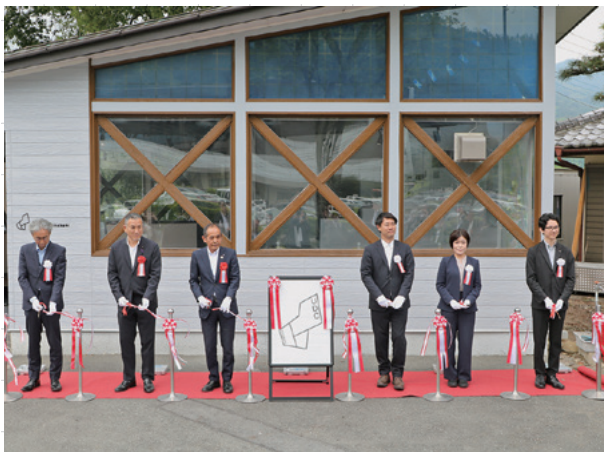
▲オープニングセレモニーの様子

式典後にはセンターの見学会が行われ、東京大学大学院の学生やUDCメンバーによる、フィールドワークを通して作成した調査資料や、町の立体模型の説明が行われました。