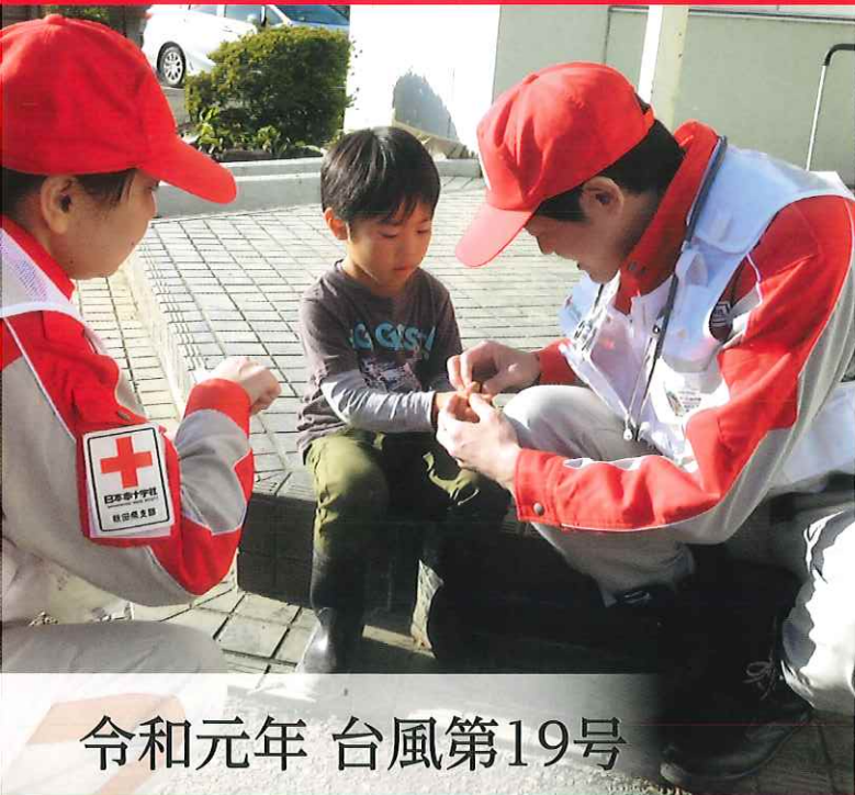
令和元年 台風第19号