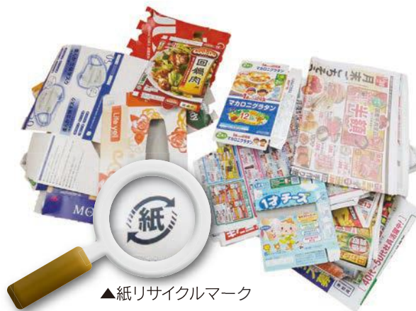
▲紙リサイクルマーク

紙類には大きい物や小さい物などさまざまなサイズがあり、あらかじめ専用の袋やスペースを確保しないと分別するのが非常に面倒になります。次の手順を参考にし、普段、新聞紙を出す感覚で実践してみてもいいのではないでしょうか。