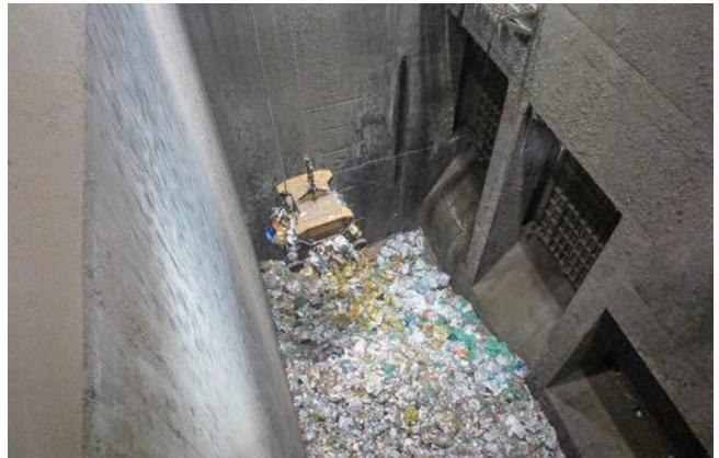
▲現在のごみピット