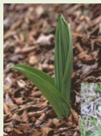
芽出し期 のバイケイ ソウ