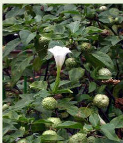
チョウセン アサガオの葉と花