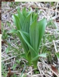
芽出し期 のコバイ ケイソウ