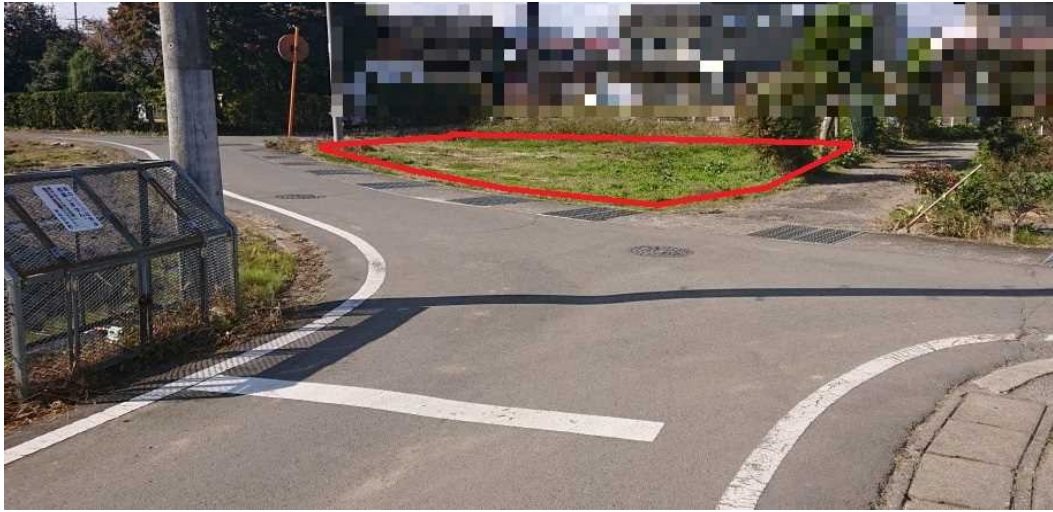
対象地の南側から撮影