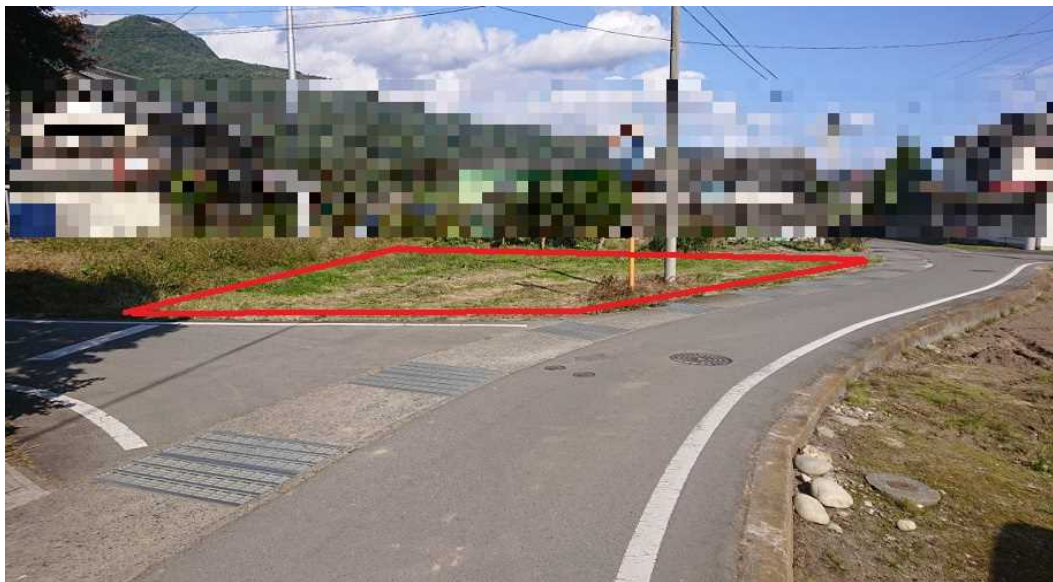
対象地の西側から撮影